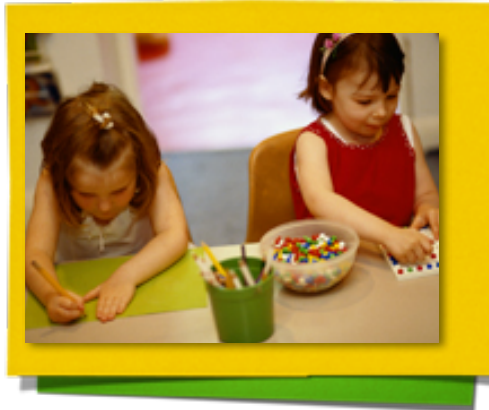
En Cumplimiento con TCCED

1407 W. Moore Rd. Pharr, TX 78504 Ph.: 956 7813056 Ext.106 Fax.: 956 781-15-14 www.oratoryschools.org